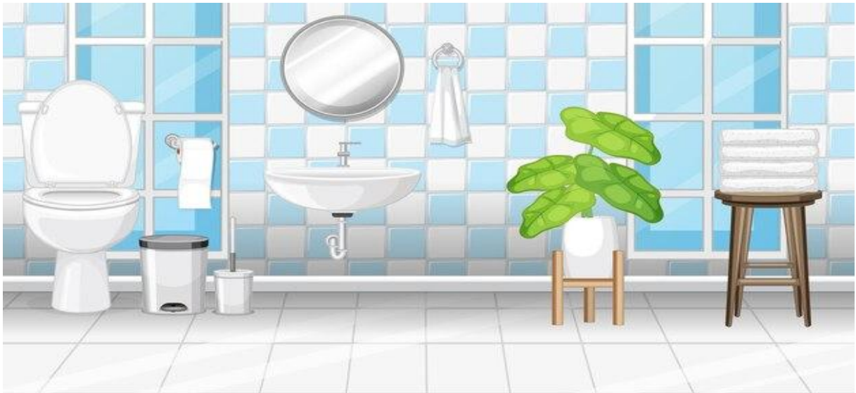
(Croquis des toilettes, lavabo, latrines)

Elles doivent être maintenues propre afin d'éviter les mauvaises odeurs et les maladies.