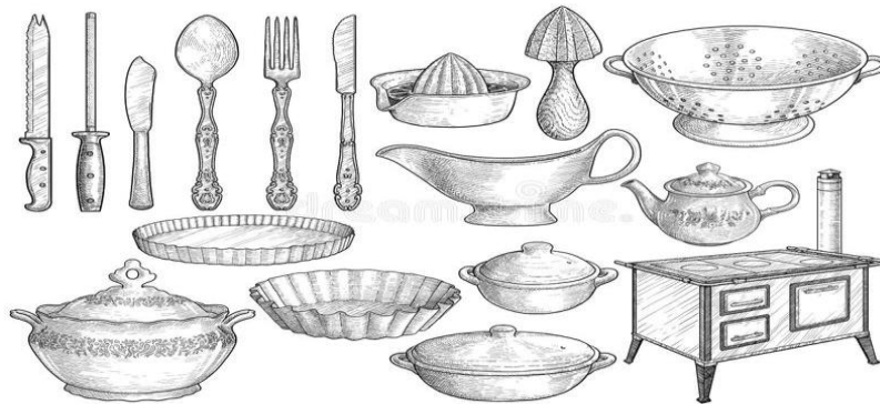
(Croquis des ustensiles de cuisine)

Ils doivent être solides, pratiques et de formes simples.